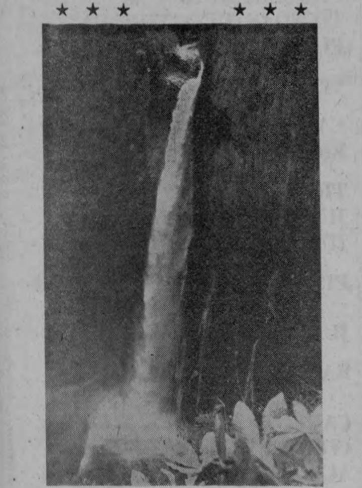
Como plata retumbante se lanza en la boca negra del abismo la hermosa catarata del Río Toro, haciendo temblar los basaltos del cañón y los brazos paralizados de la selva...