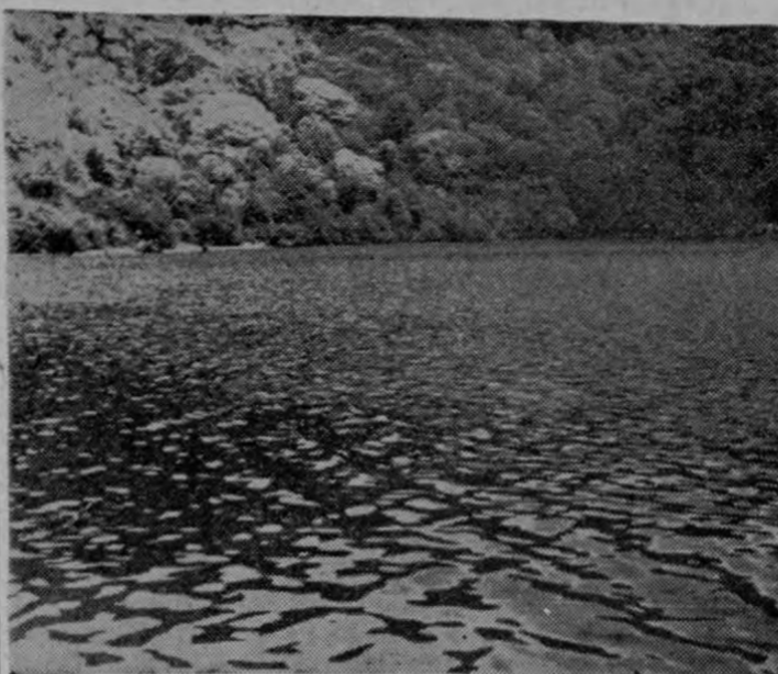
Besando la planta de los bosques de arrayán la laguna del Volcán Poás semeja un espejo de brillo verde, en el que se miran, desde lo alto, los narcisos con plumas que se atreven por entre nubes de azufre...

món. A las cinco de la mañana estará Ud. en el Puerto del Atlántico gozando del maravilloso escenario de las aguas caribes y los bosques tropicales. En una camioneta que sale cada media hora de la esquina Nor-Este del Mercado puede Ud. visitar Portete y darse un confortante baño de mar. También puede alquilar un automóvil y llegar a Moín para navegar por las aguas del río durante horas y horas. Los hoteles cobran precios módicos y en restaurantes como los hay en San José almorzar y comer a bajo precio. Un viaje por ferrocarril siempre es una amable experiencia.